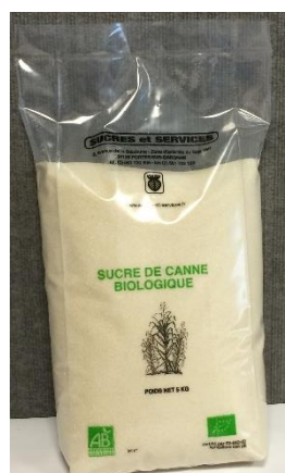
sucré de canne biologique clair Brésil