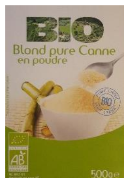
Sucré de canne biologique en poudre