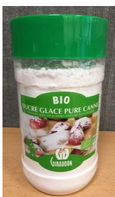
sucré glace biologique canne clair amyacé