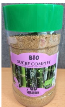
sucré de canne biologique complet Colombie