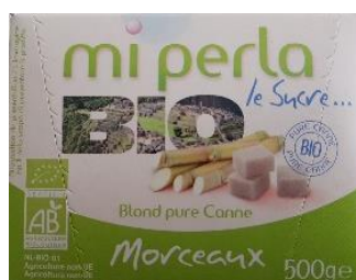
sucré de canne biologique morceaux