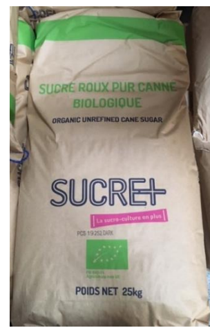
sucre de canne biologique foncé Costa Rica ou Laos