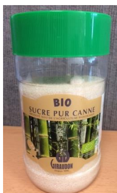
sucré de canne biologique clair Brésil