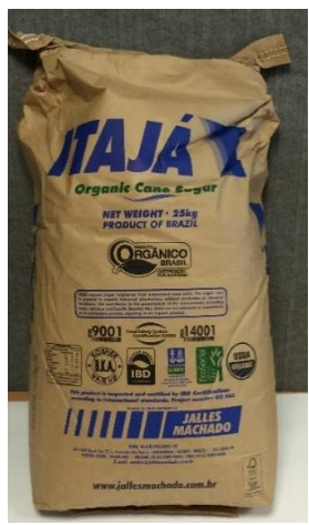
sucre de canne biologique clair Brésil