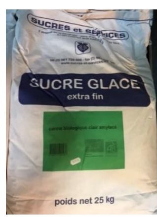
sucre glace biologique canne clair