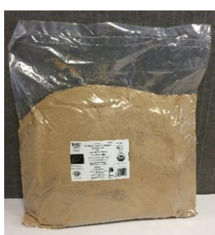
sucre de canne biologique complet rapadura