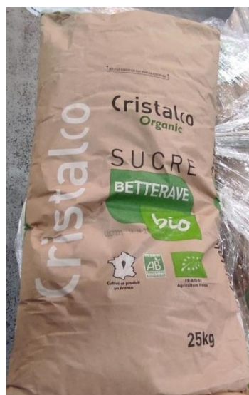
sucre de betterave biologique France